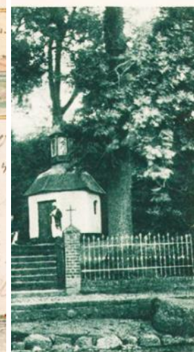
Żytna kapliczka na miejscu idownym w Swarzewie.