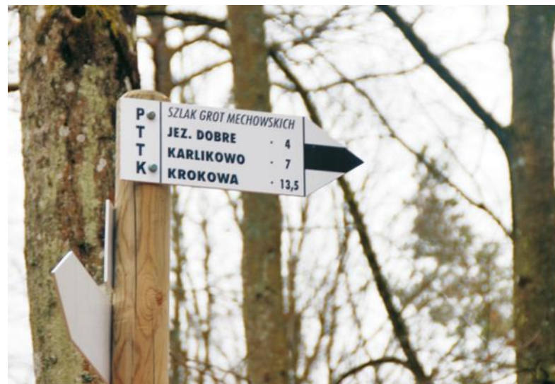
Szlakiem Grot Mechowskich można zobaczyć też głązy narzutowe

Akwen ma ponad dwadzieścia hektarów powierzchni oraz maksymalną głębokość sześciu metrów. Wszystkie brzegi oraz jedyną wyspę porasta las sosnowy. Na północnym brzegu pomiędzy drzewami znajdują się pomosty, parking, pole biwakowe, na którym w lecie można