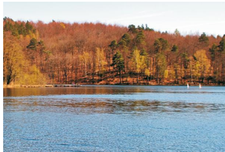
Dogodne warunki do wędkowania i amatorskiego żeglowania

Jezioro Dobre położone na skraju Puszczy Darżlubskiej wzdłuż drogi z Wejherowa do Krokowej obfituje w różne gatunki ryb: płocie, leszcze, karpie, karasie, okonie, szczupaki oraz węgorze.