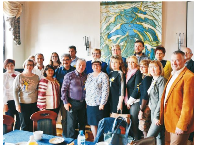
Delegacja z Odessy spędziła tydzień na Pomorzu

W dniu 24 kwietnia 2018 r. burmistrz Pucka oraz dyrektorzy pucckich placówek oświatowych przyjęli 17-osobową grupę z Odessy - ukraińskich nauczycieli, dyrektorów szkół, kierowników wydziałów oświaty oraz ośrodków metodycznych z obwodu odeskiego.