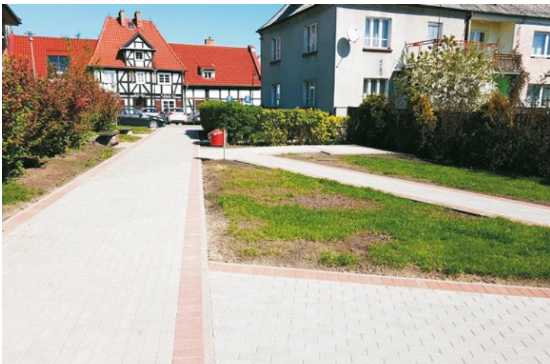
Ciągi piesze między ulicą Wałową a Placem Obrońców Wybrzeża

Nowy blask zyskał skwerek pomiędzy ul. Wałową a Placem Obrońców Wybrzeża, stare płytki betonowe