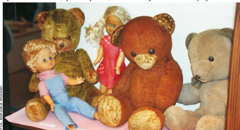
Ekspozycja dawnych zabawek w Szpitaliku. Można pograć w klasy i kapsle

- Rzeczywiście ewangelicy w Pucku to głównie osoby narodowości niemieckiej i warto o nich pamiętać, choć było ich nie więcej niż dwa-