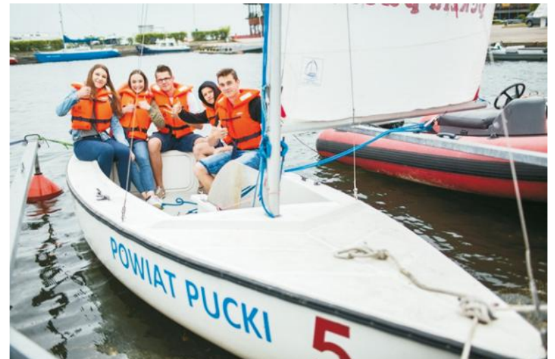
Blisko 20. uczniów nabywa właśnie umiejętności pozwalające na prowadzenie łodzi żaglowych

Dodajmy, że Powiat Pucki już od kilkunastu lat finansuje zajęcia na