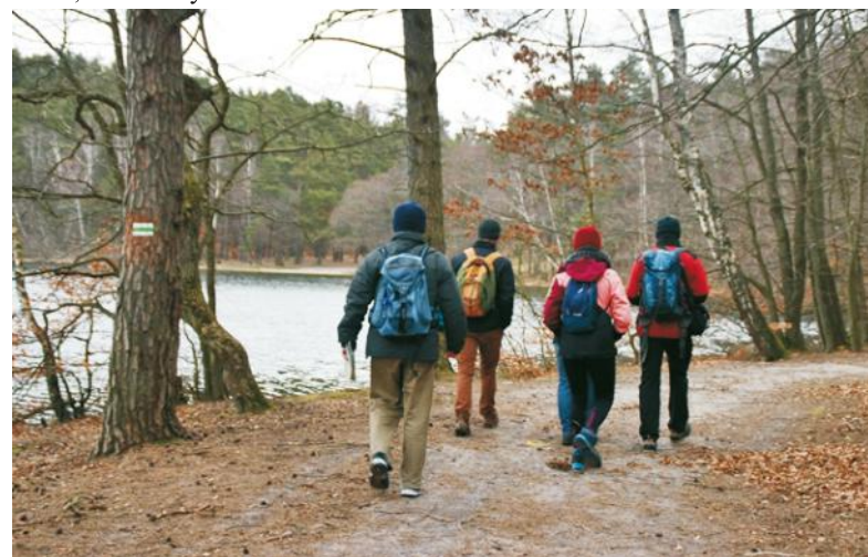
Wokół jeziora piesi wędrują szlakiem zielonym lub czarnym