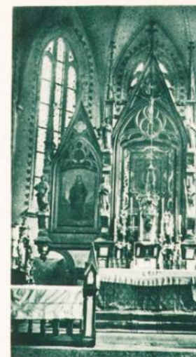
Cudowny obraz Matki Boskiej w Swarzewie.