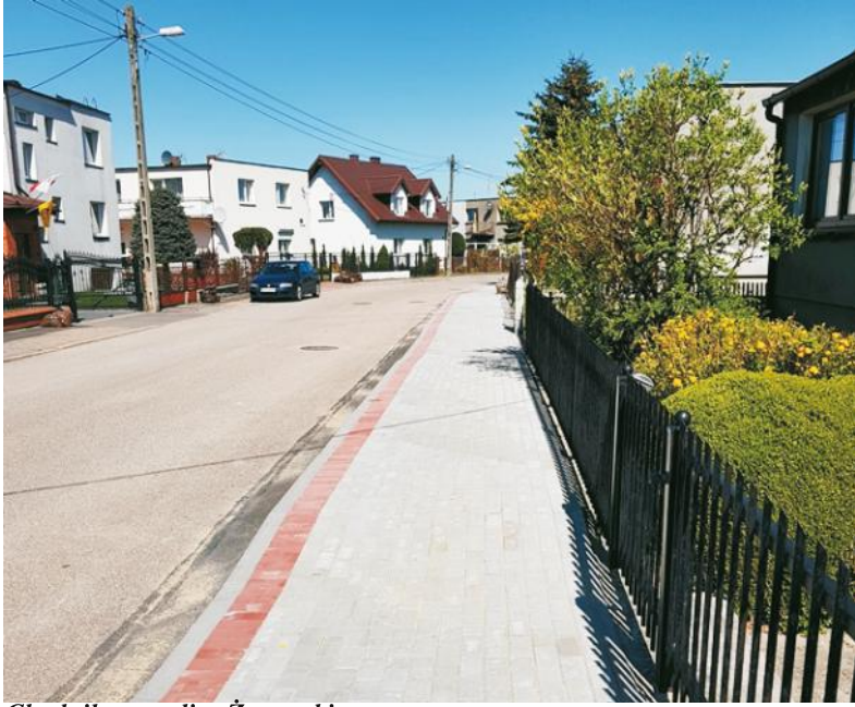
Chodnik przy ulicy Żeromskiego

Przy ulicach 10 Lutego, Żeromskiego, przy Placu Obrońców Wybrzeża samorząd miejski dokonał zmian wizerunkowych.