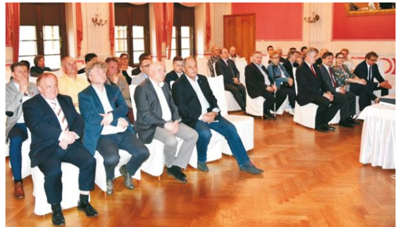
W spotkaniu uczestniczyli okoliczni władarze miast i gmin