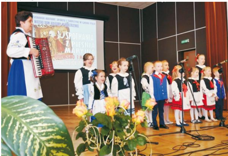
„Sztrądowne Òstë” z Żelistrzewa podczas występu