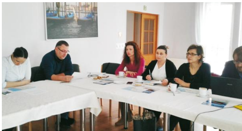
Konsultacje nad konspektem i próbą graficzną wśród specjalistów od turystyki i przyrody

Północnych - tworzenie marki turystycznej Kaszub Północnych poprzez przygotowanie i promocję oferty przyrodniczej” to tytuł projektu w ramach którego są realizowane powyższe zadania przez Stowarzyszenie Turystyczne „Kaszuby Północne” Lokalna Organizacja Turystyczna.