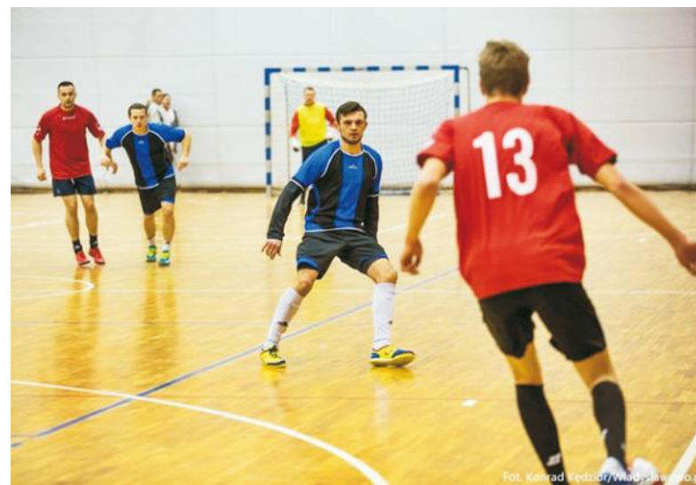
Piłkarze Bajadery (czarno-granatowe stroje) w trakcie meczu