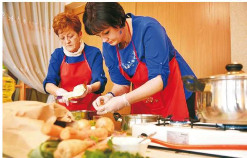
Stroje i estetyka były też ważne przy ocenie