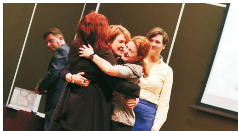
Członkowie stowarzyszenia „Zrozumieć świat” nie kryli emocji