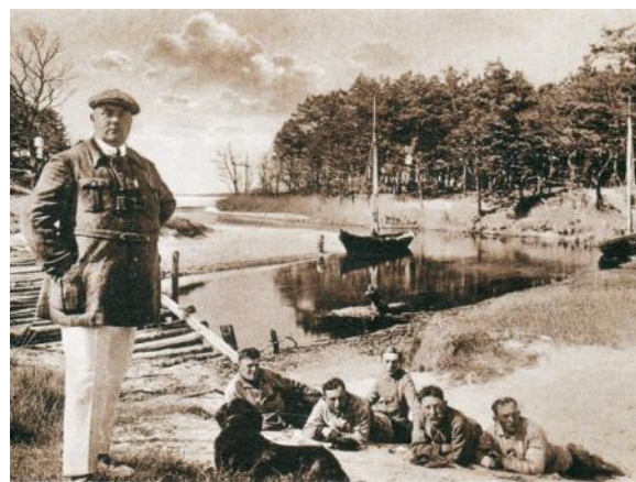
Dębki. U ujścia Piaśnicy.