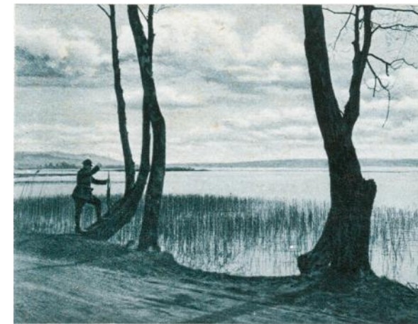
Jezioro Żarnowieckie, granica polsko-niemiecka.