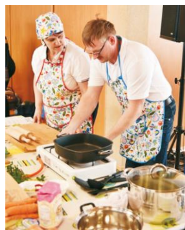
Oddział ZKP w Lipuszu reprezentował team mieszany