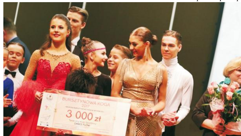
Zawodowi tancerze z klubu Dance Flow z Helu z nagrodą