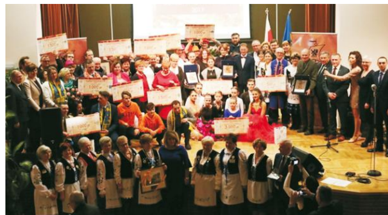
Spośród siedemnastu zgłoszeń wybrano trzy nagrody główne