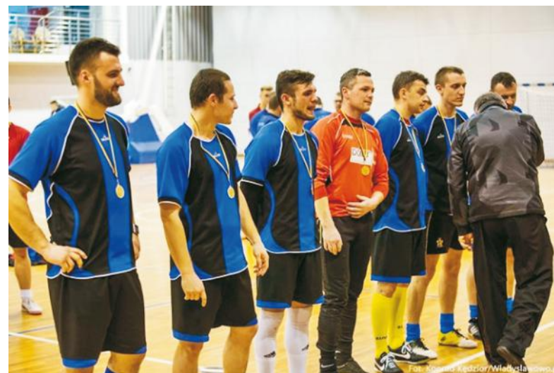
Powiatowi mistrzowie futsalu - Bajadera