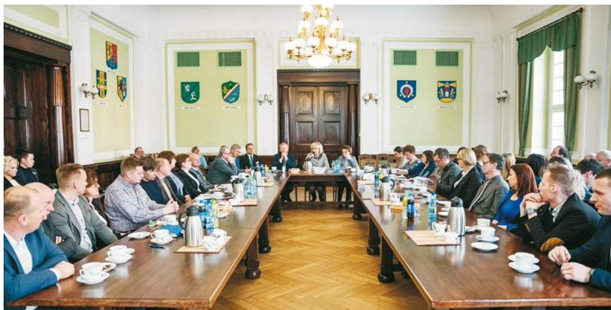
Powiat Wejherowski sprawuje kontrolę nad 33 szkołami - ponad połowa zajmuje się kształceniem zawodowym

Przypomnijmy, że pod koniec 2016 r. Powiat Wejherowski pozyskał rekordową kwotę ponad 24 mln zł na Zintegrowany Projekt Zawodowy, który już niebawem zaowocuje nie tylko podniesieniem jakości szkolnictwa zawodowego na terenie powiatu wejherowskiego, ale także poszerzeniem oferty kształcenia ustawicznego i dostępem do nowoczesnych technologii i usług cyfrowych. Takich pieniędzy na rozwój szkolnictwa zawodowego, jak zaznaczyła starosta wejherowski Gabriela Lisius, w historii powiatu