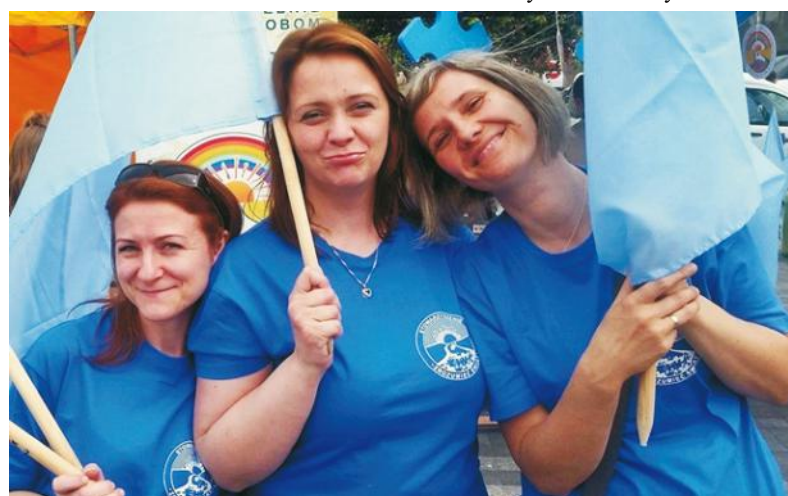
Członkowie stowarzyszenia integrują się w tych dniach

ku, szkolenia i warsztaty dla osób pracujących z autystami, integracja środowiska, wspólne układanie wybranej formy z niebieskich nakrętek i wiele innych punktów tworzą plan naszych obchodów. Stowarzyszenie obejmuje opieką i terapią osoby z autyzmem i ich rodziny. Stanowimy grupę wsparcia. Aktualnie mamy 17 rodzin, w tym 14 dzieci ze spektrum autyzmu i łącznie 55 osób w stowarzyszeniu. Autyzm dotyka całą rodzinę. Praca z takim dzieckiem trwa 7 dni w tygodniu przez 24 godziny. Naszym zadaniem jest wprowadzić dzieci zaburzone w świat osób niezaburzonych, neurotypowych. Nie jest to łatwe, zajmuje to dużo czasu i trzeba mieć dużo cierpliwości. Przez cały rok coś organizujemy, pozyskujemy granty na hipoterapię, hydroterapię, terapię ruchową, indywidualną, zajęcia z logopedą, spotkania z psychologiem dla profilaktyki. Pomoc psychologiczna