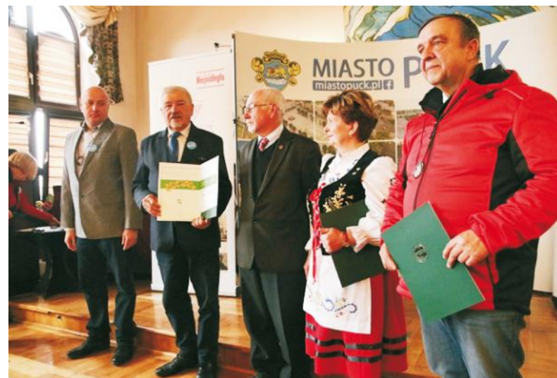
Wręczono liczne odznaczenia i wyróżnienia