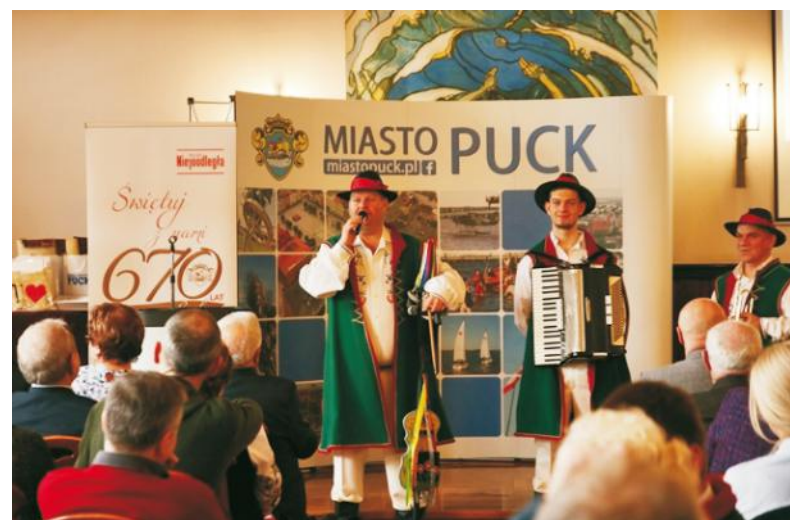
Uczestnicy po powitaniu obejrzeni występ artystyczny zespołu Manijôcë