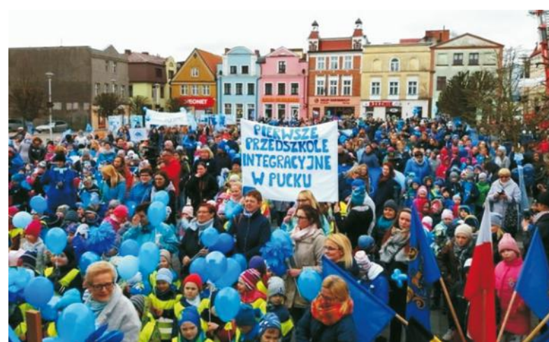
Przedszkolaki, uczniowie szkół gromadzą się wspólnie z niebieskimi gazetami

dla naszych dzieci i dla nas jest bardzo ważna. Statystycznie rzecz biorąc bardzo dużo osób, opiekunów niepełnosprawnych ma depresję, zbadano, że 85 procent to rodzice osób z autyzmem. Wewnętrznie organizujemy Dzień Dziecka, Mikołajki, czynnie udzielamy się w