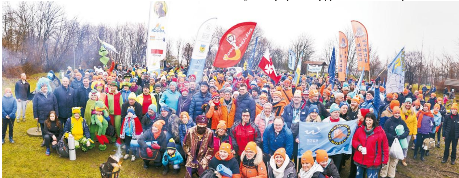
Pamiątkowe zdjęcie uczestników na rozpoczęcie imprezy