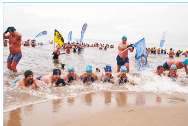
Rzesza morsów z całego kraju wspólnie weszła do Bałtyku