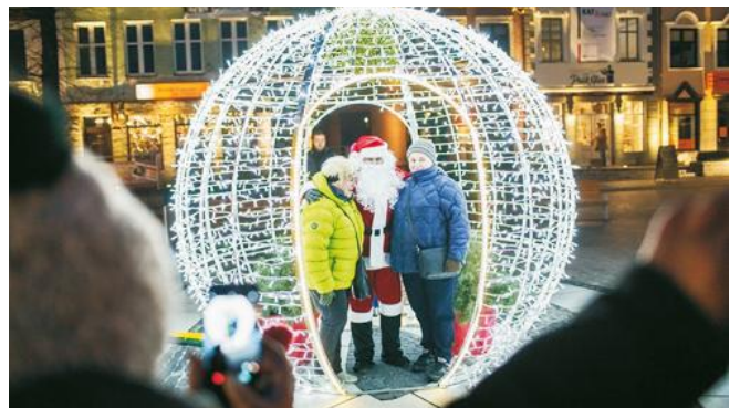
Święty Mikołaj chętnie pozwalał do zdjęć

i ciuchcia, bajkowe postacie, szczudlarze, malowanie buziek, fotobudka, przejażdżki kucykami, wóz strażacki, radiowóz. Dorośli również mogli znaleźć coś dla sie-