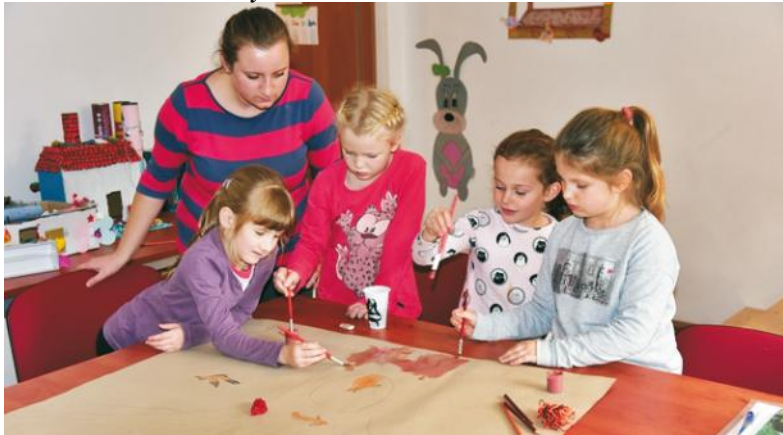
Zajęcia plastyczne w Białogórze