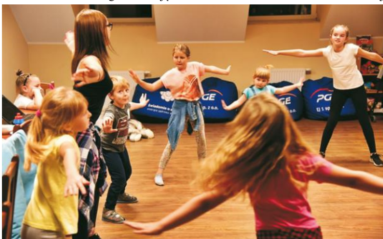
Nauka baletu w świetlicy w Jeldzinie