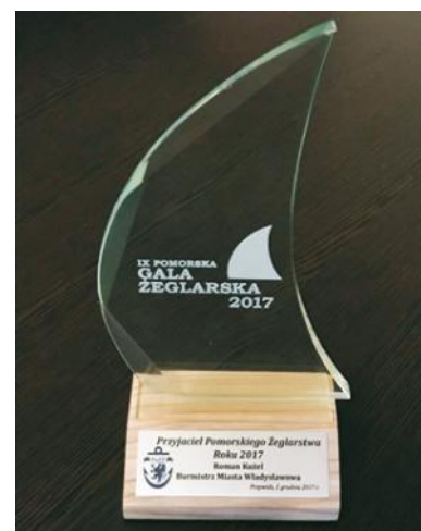
Statuetka dla burmistrza Władysławowa za wspieranie pomorskiego żeglarstwa

Ponadto, pod koniec 2016 r. na spotkaniu w COS OPO Cetniewo we Władysławowie powołano Polskie