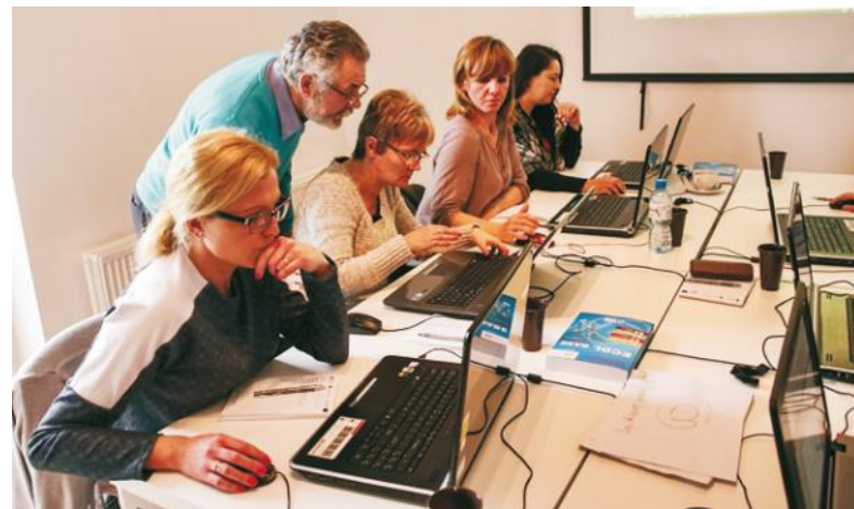
Beneficjenci podnoszą kwalifikacje m.in. poprzez szkolenia z obsługi komputera

Powiat Pucki w partnerstwie z Fundacją Phenomen realizuje projekt „Aktywizacja zawodowa osób pozostających bez pracy w Powiecie Puckim - etap I” współfinansowany ze środków Europejskiego Funduszu Społecznego Unii Europejskiej w ramach Regionalnego Programu Operacyjnego Województwa Pomorskiego na lata 2014-2020.