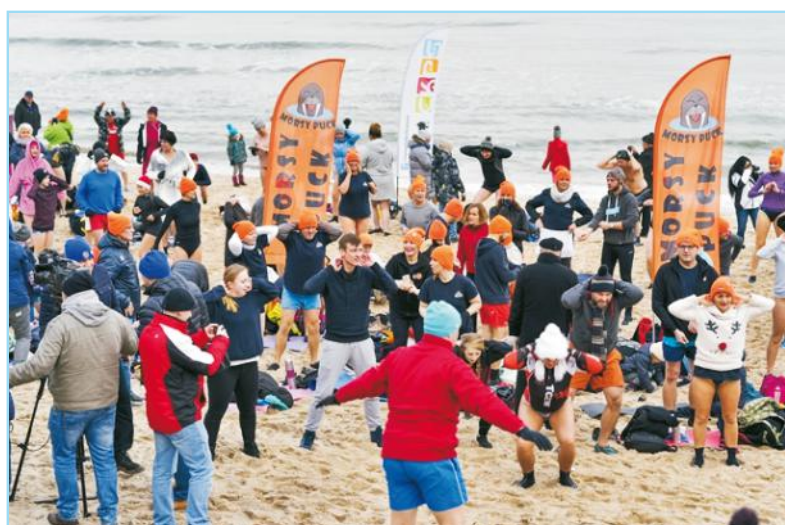
Przed wejściem do wody obowiązkowa rozgrzewka