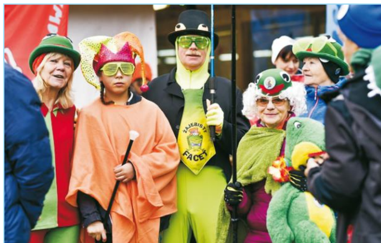
Niektórzy poprzebierali się w kolorowe stroje