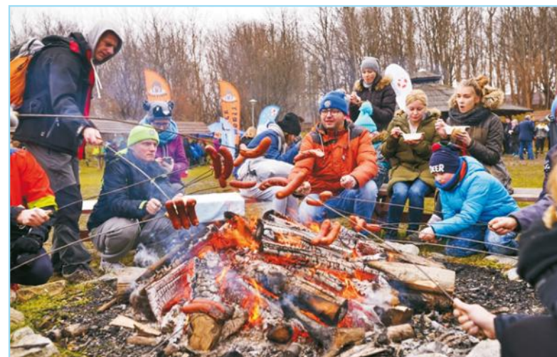
Organizatorzy zapewnili ciepły posiłek i obojętnościowy tort