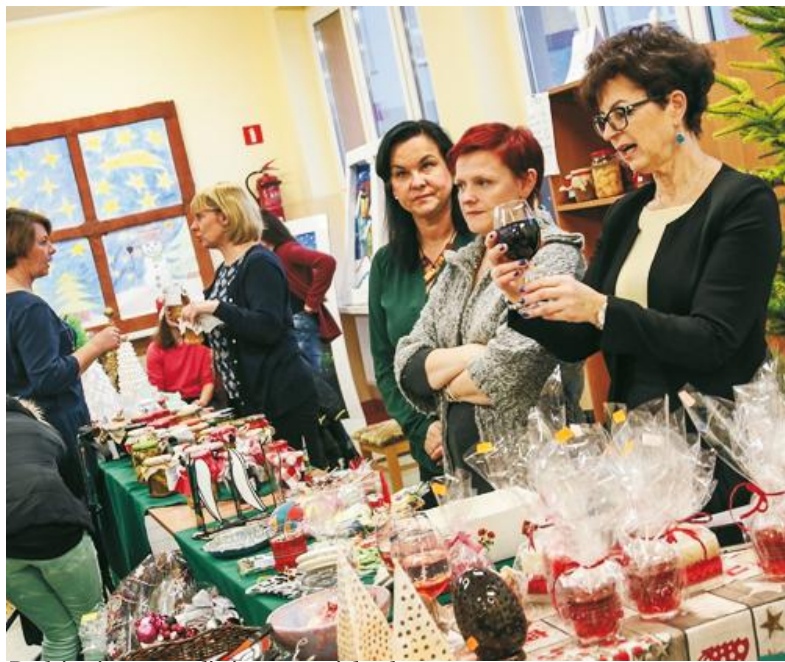
Rodzice integrowali się przy stoiskach