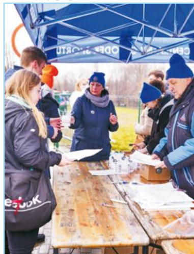
Pamiątkowe kubki i butony trafiły do uczestników przy rejestracji