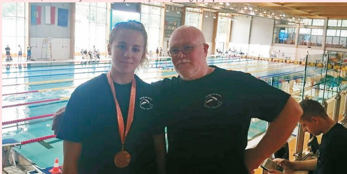
Trener z medalistką w pływaniu w płetwach