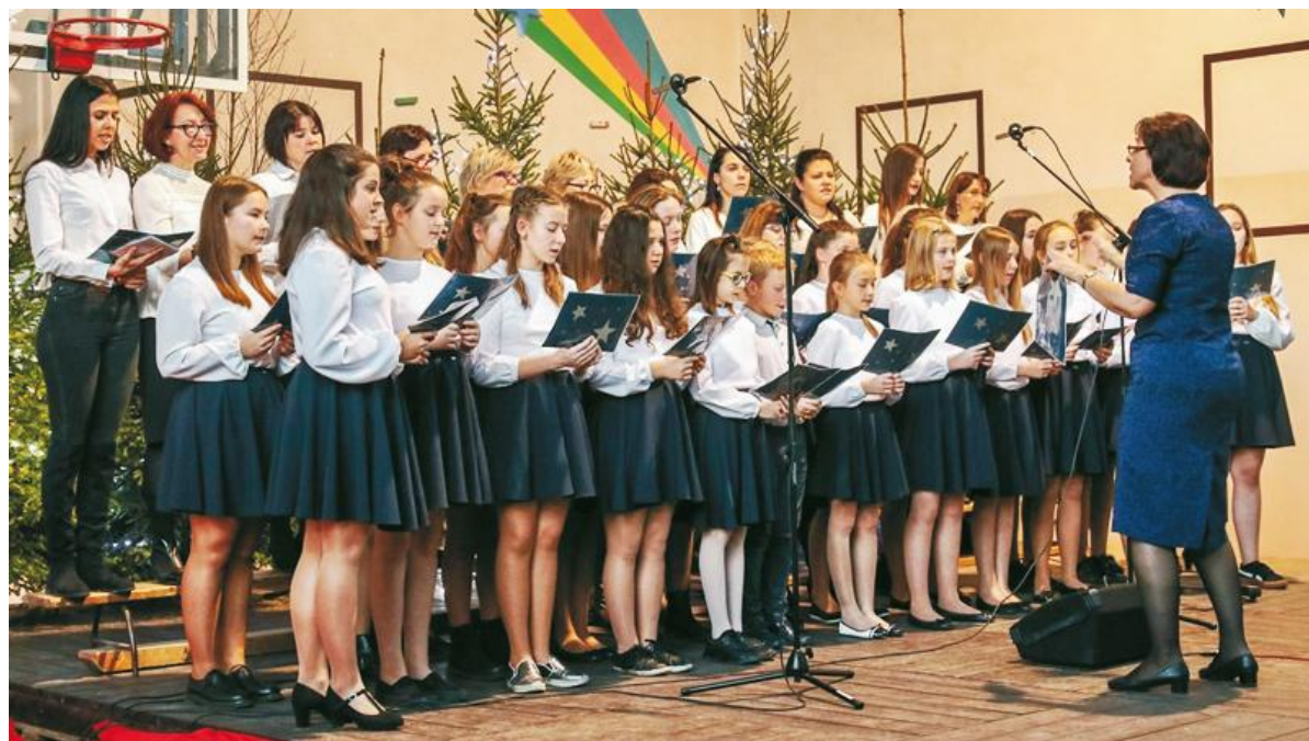
Gości zachwycił bogaty program artystyczny