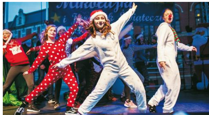
Na scenie wystąpili Da Capo Al Fine, Migotki i puccy uczniowie

bie korzystając ze świątecznego jarmarku. Na scenie mogliśmy zobaczyć Da Capo Al Fine, Migotki, uczniów niepublicznej szkoły podstawowej oraz Szkoły Podsta-