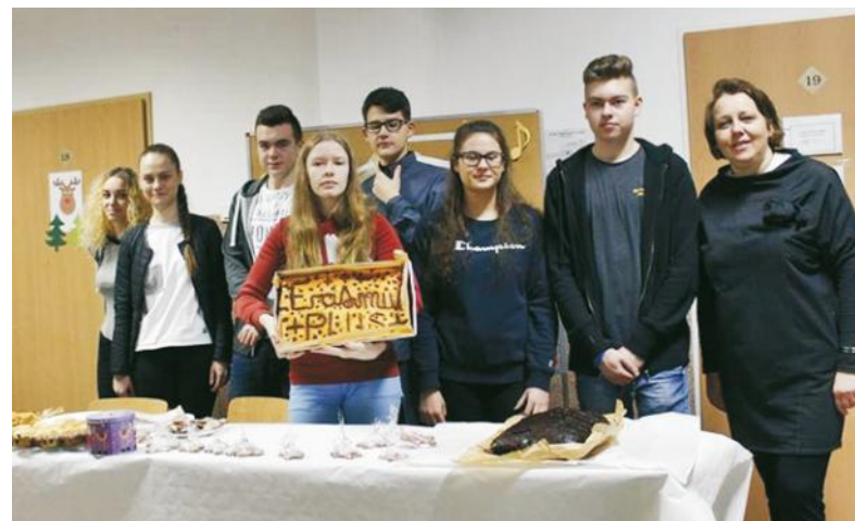
To drugie z kolei spotkanie integracyjne przed Bożym Narodzeniem