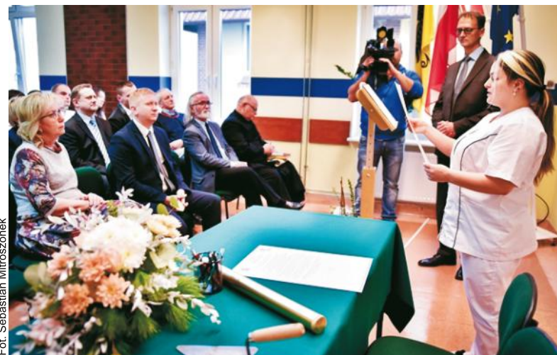
W kolejnej placówce odbyło się uroczyste podpisanie i wmurowanie aktu erekcyjnego pod rozbudowę szkoły

Ewa Wajs Starostwo Powiatowe w Wejherowie