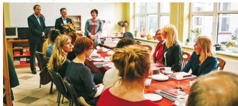
Przedstawiciele władz powiatu złożyli życzenia pracownikom PCPR