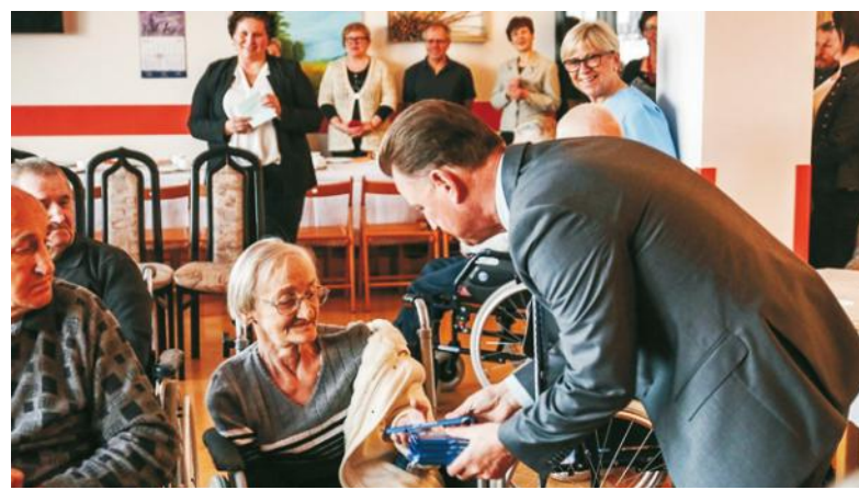
Starosta pucki spotkał się z podopiecznymi DPSu w Lubkowie