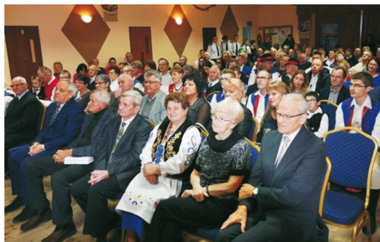
Występy odbywały się przy zapelnionej sali