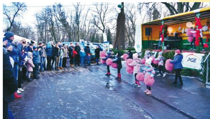
Cheerliderki z Prusewa rozgrzały uczestników swoim występem

Rozstrzygnęliśmy konkurs na kartkę bożonarodzeniową. Była też ścianka z Mikołajem i Elfem, przy której można było zrobić sobie zdjęcie. Karuzela zapraszała wszystkie dzieci w podróż przeróżnymi pojazdami, a Mikołaj pojawił się nie wiadomo skąd i koszyk miał wypełniony słodkościami. Zamek w Krokowej przy-