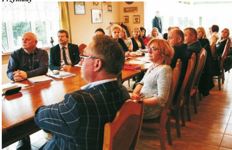
Szkolenie okazało się bardzo inspirujące dla uczestników