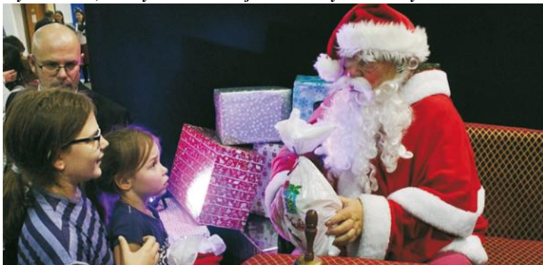
Wyczekiwany Mikołaj przyniósł wór prezentów