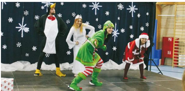
Myszka Miki, Śnieżynka i inne bajkowe stwory odwiedziły dzieci