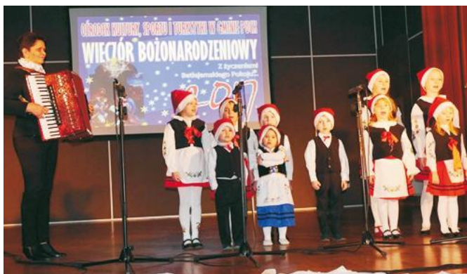
Wieczór w Żelistrzewie stał pod znakiem rodzinnych zespołów

Spotkanie wokół symbolicznego opłatka i kolędowej pieśni to tradycja kultywowana w gminie Puck od lat. Na sali wspólnie zasiedli ludzie tworzący i wspierający życie spo-