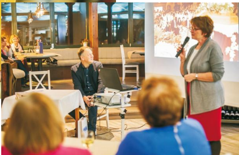
Pisarz opowiedział przebieg śmierci Grzegorza Przymyka

Gmina Puck. Spotkanie Rodzin Muzykujących