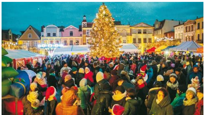
Zapaleniu choinki towarzyszyło srebrne konfetti

Kolejny rok Puck zamienił się w krainę Świętego Mikołaja, w której dzieci mogły skorzystać z wielu atrakcji, w tym przejażdżki saniami Świętego Mikołaja, karuzela