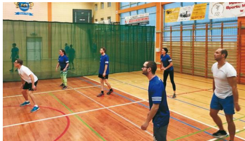
Grupa nauczycieli z Helu zajęła w rozgrywkach piąte miejsce

Na hali POSM w Pucku odbyły się zawody dla nauczycieli w piłce siatkowej o Puchar Starosty Powiatu Puckiego.