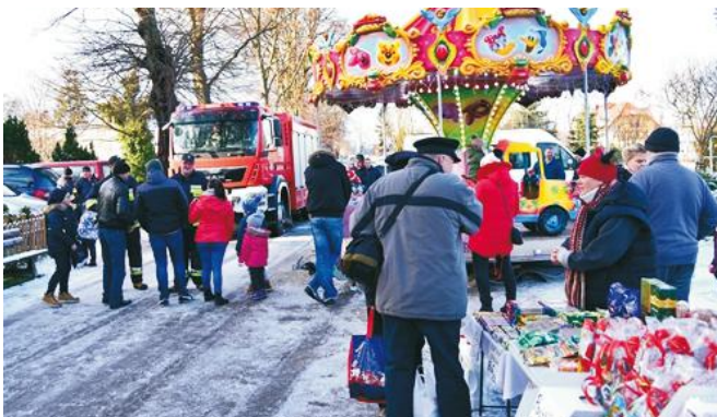
Karuzela zapraszała dzieci w podróż przeróżnymi pojazdami