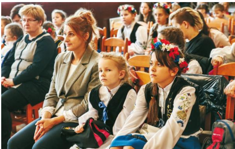
W konkursie mowy kaszubskiej wzięli udział uczniowie szkół podstawowych, gimnazjalnych i ponadgimnazjalnych