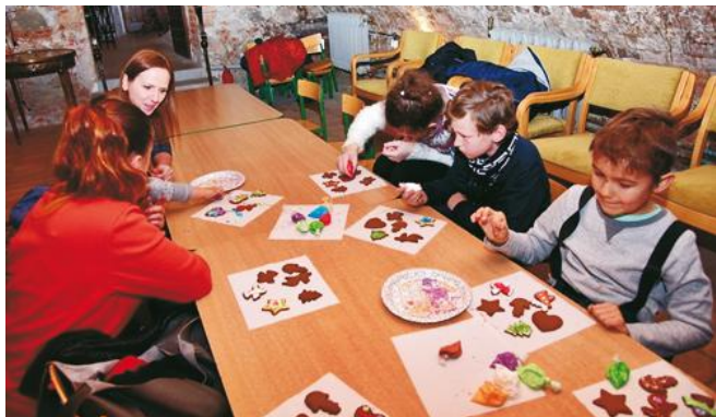
W ofercie były warsztaty świąteczne z malowania pierników

Świąteczne ozdoby i smakołyki, przedmioty z duszą, karuzela dla dzieci - to tylko niektóre atrakcje jarmarku bożonarodzeniowego w Krokowej. Występ Orkiestry Dętej OSP Sławoszyno rozpoczął wydarzenie, a przez cały dzień słuchano kolęd i pastorałek w róż-