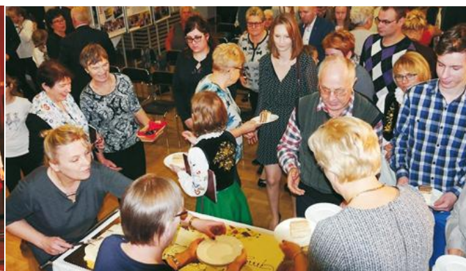
Impreza zakończyła się poczęstunkiem przy świątecznym torcie

Wieczór w Żelistrzewie stał pod znakiem występów rodzinnych ze-