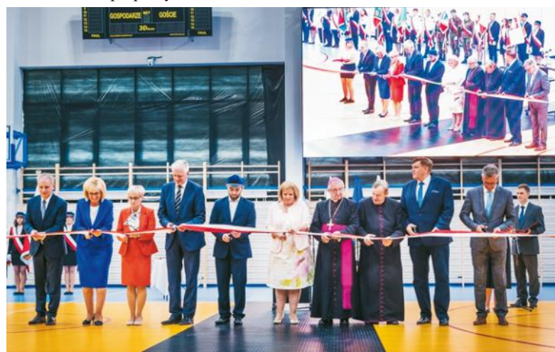
W uroczystości otwarcia hali udział wzięły władze państwowe, wojewódzkie, powiatowe oraz oświatowe

sportowymi m.in. Tytani Wejherowo, Gryf Wejherowo czy Błękitni Wejherowo. Ponadto z sali sportowej korzystać będzie mogła również społeczność lokalna. Obiekt umożliwi organizację zawodów sportowych o zasięgu krajowym lub międzynarodowym.