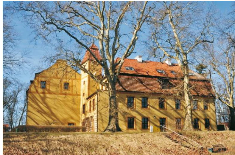
Bryła zamku od strony wschodniej

Zamek Krokowa ul. Zamkowa 1, 84-110 Krokowa tel. 58 77 42 111, kom. 605 333 269 www.zamekkrokowa.pl e-mail: recepcja@zamekkrokowa.pl