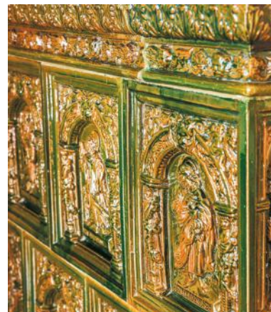
Zabytkowy piec zdobi wnętrze