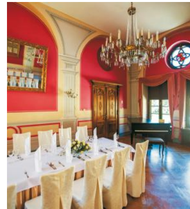
Sala balowa im. Luizy

inicjatywy Albrechta von Krockow oraz ówczesnego wójta Gminy Krokowa powstała Fundacja Europejskie Spotkania Kaszubskie Centrum Kultury Krokowa, która przy pomocy funduszy Fundacji Współpracy Polsko-Niemieckiej odbudowała pałac z przeznaczeniem na hotel, restaurację i muzeum.