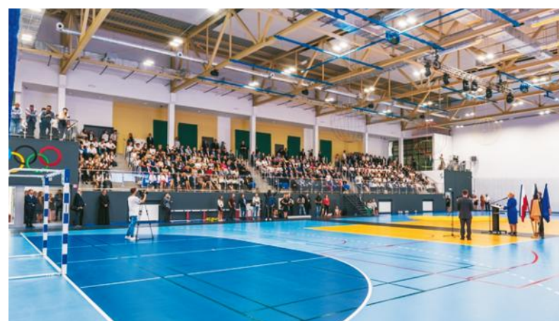
Pełnowymiarowa hala sportowa przy wejherowskiej „samochodówce” to w tej chwili jedyny taki obiekt w Wejherowie

W nowej hali prowadzone będą nie tylko zajęcia lekcyjne i pozalekcyjne. Powstały obiekt umożliwi rozszerzenie współpracy z klubami