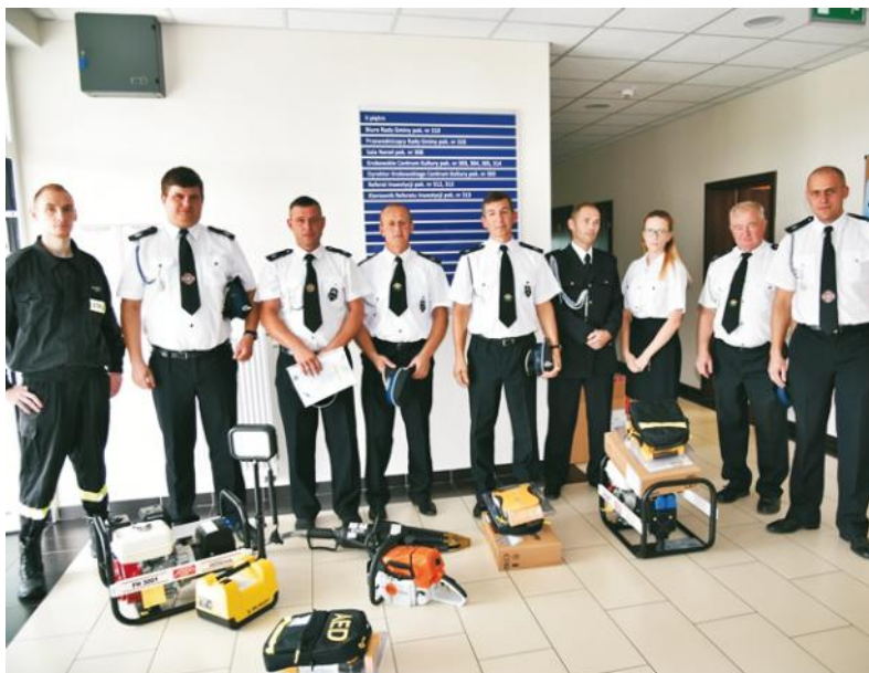
Sprzęt dla jednostek OSP trafił w ręce strażaków

W dniu 29 sierpnia 2018 r. na sesji Rady Gminy Krokowa odbyło się uroczyste przekazanie wyposażenia i urządzeń ratowniczo-gaśniczych o łącznej kwocie 64 969,69 zł. Obdarowane zostały jednostki: OSP Wierzchucino, OSP Sobieńczyce, OSP Krokowa, OSP Prusewo, OSP Sławoszyno, OSP Karlikowo i OSP Żarnowiec.