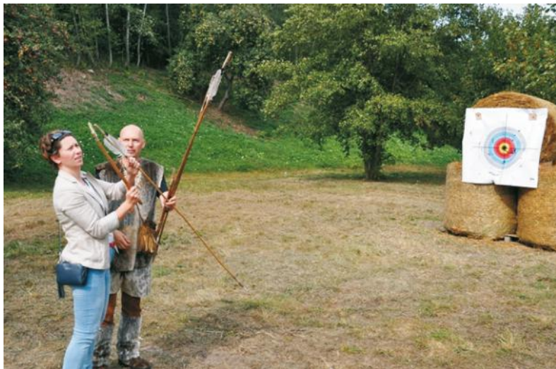
Rzucanie oszczepem przy pomocy miotacza z epoki kamienia