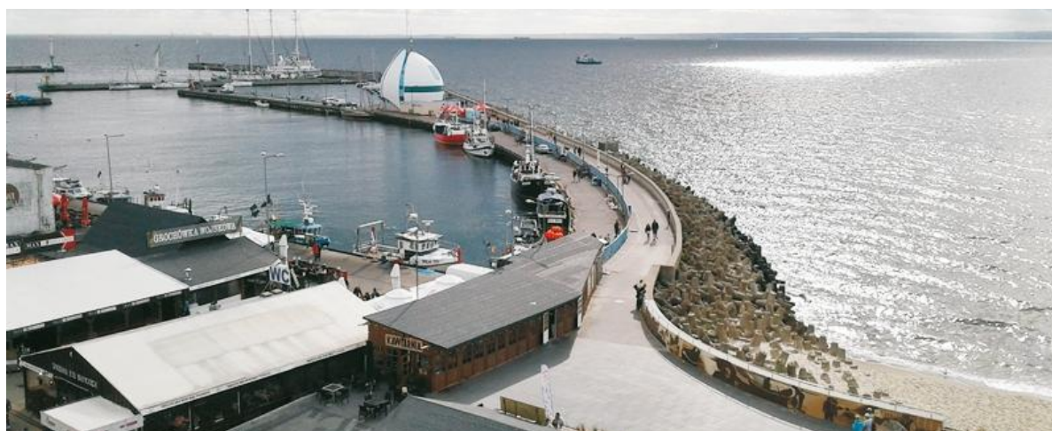
Widok na helski port

Uczestnicy kosztowali również specjalów kuchni kaszubskiej, w tym szczególnie chętnie dań rybnych w działających restauracjach.