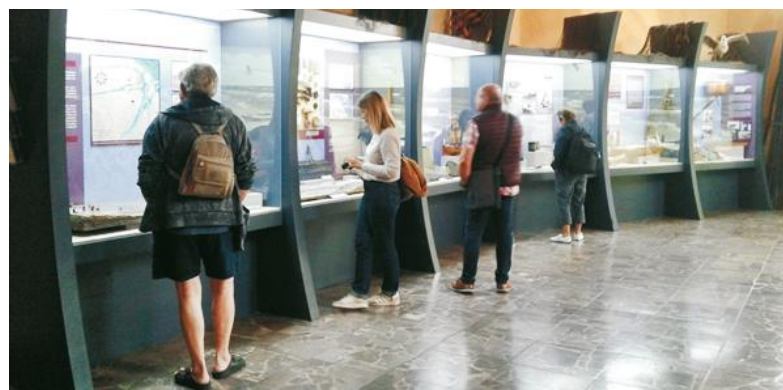
Muzeum Rybołówstwa w Helu