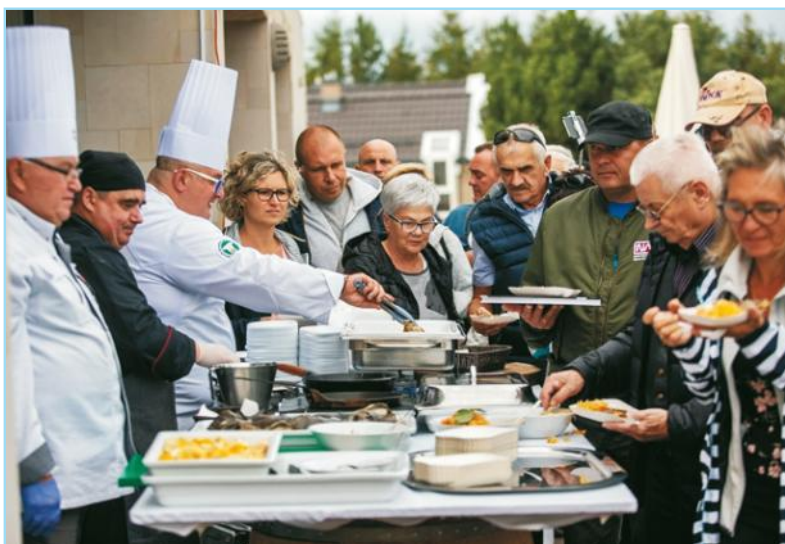
Szefowie kuchni częstują daniem z ryb

Barbara Mudlaff LOT Kaszuby Północne