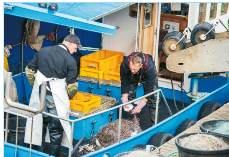
Pokaz łowienia rybaków

Program pozwolił uczestnikom skorzystać ze stoisk wypełnionych lokalnymi produktami: serami, miodami, chlebem i rękodziełem prezentowanym przez wystawców polskich, czeskich i niemieckich. O stronę muzyczną drugiego dnia festiwalu zadbał zespół Deadly Plants. Był też kącik z atrakcjami dla dzie-