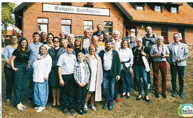
Zaangażowani w projekt Kaszubi, Polacy, Litwini, Duńczycy, Szwedzi i Niemcy