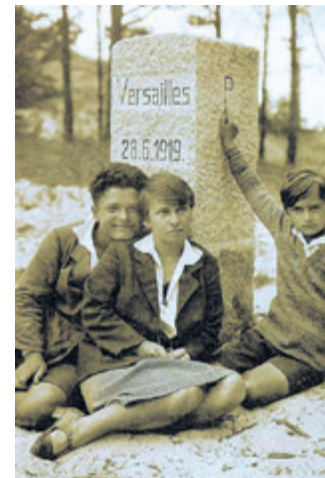
▲ Oryginalny słupek graniczny przy rzece Piaśnicy